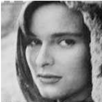
Lucia Bosè, Milano, 1953

Correvano gli anni 50/60 (del secolo scorso) e Milano si svegliava, lavorava, correva per mettere in se- sto i guai ed i danni della seconda guerra mondiale. Allora giravano pochi soldi ed io ero apprendista (senza regole di assunzione e con un contratto scritto a mano su un pezzo di carta) del quotidiano del pomeriggio "La Notte", diretto dal mitico giornalista Nino Nutrizio ( alzate il culo dalla sedia, lazzaroni, andate per strada, se la notizia non