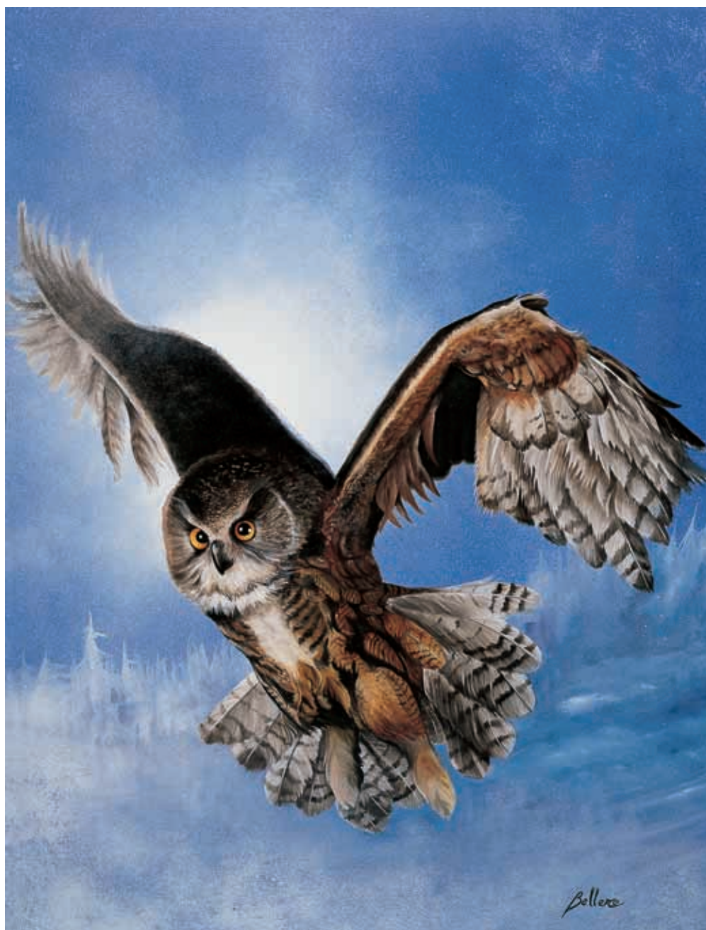
Notturmo olio - 50x70 cm