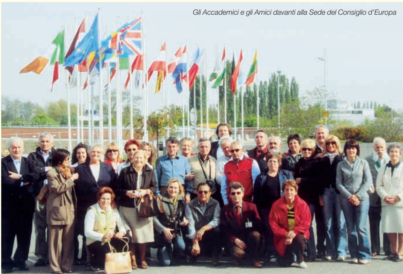
Gli Accademici e gli Amici davanti alla Sede del Consiglio d'Europa